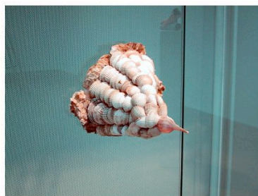
Oeuvres des élèves participants à l'atelier d' sculpture contemporaine animé par Rafael Grassi. Orangerie du château de la Louvière Montluçon, mars 2005