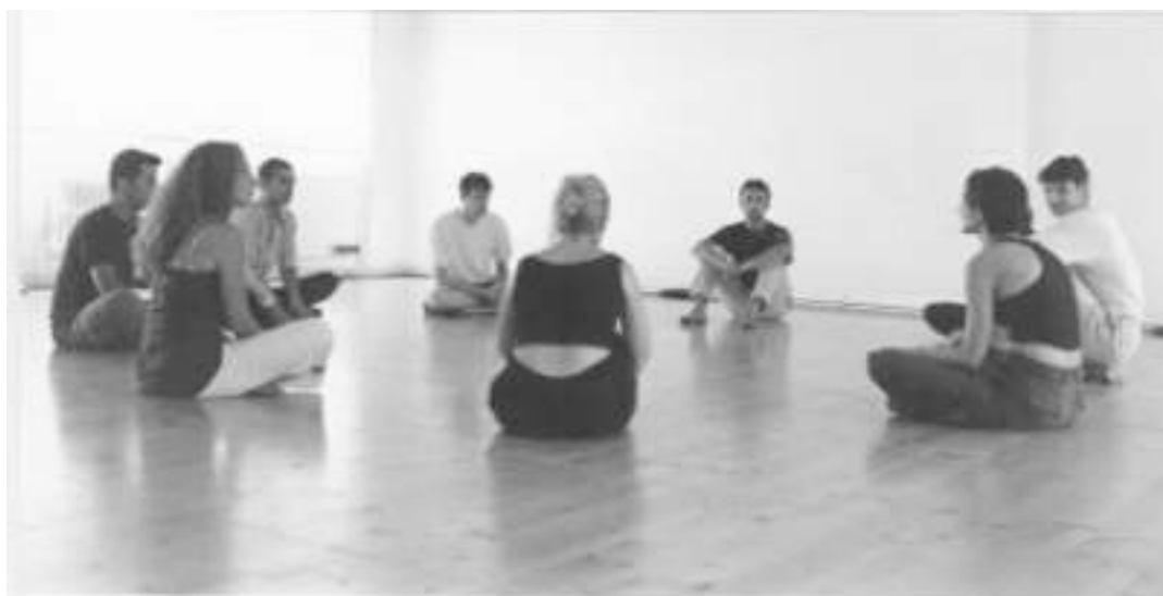
Groupe participant au stage « le corps en jeu »