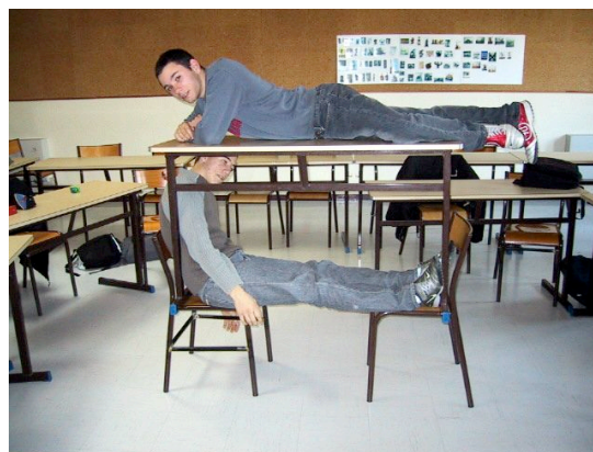
Lycée professionnel de Nerdre