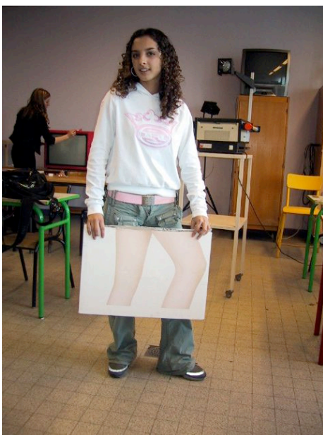
Lycée Mme de Staël, Montluçon